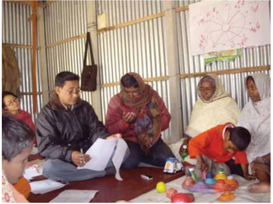
نشاط تناوب الأدوار لتوضيح كيفية الحصول على بطاقة الإعاقة، بنغلاديش

لم تسجل سوى 11 من أصل 153 أسرة للحصول على بطاقة الإعاقة الحكومية في بداية المشروع في بنغلاديش، وبحلول نهاية التدريب تلقى الجميع الدعم من أجل التسجيل. كانت معظم الأسر قد سمعت عن البطاقة، ولكن لم يكن لديهم المعلومات ذات الصلة المتعلقة بالتسجيل. اهتم جزء أساسي من التدريب بنشاط تناوب الأدوار الذي مارسه العاملون الاجتماعيون، حيث مثلوا كيفية التعامل مع القادة المحليين والخطوات الضرورية الواجب اتخاذها للحصول على بطاقة الإعاقة. كان ذلك مسلياً جداً وجعل الجميع يضحكون! وبعد الجلسة مباشرة، سجّل العديد من الآباء والأمهات وولادة أطفالهم في المكتب المحلي المختص.